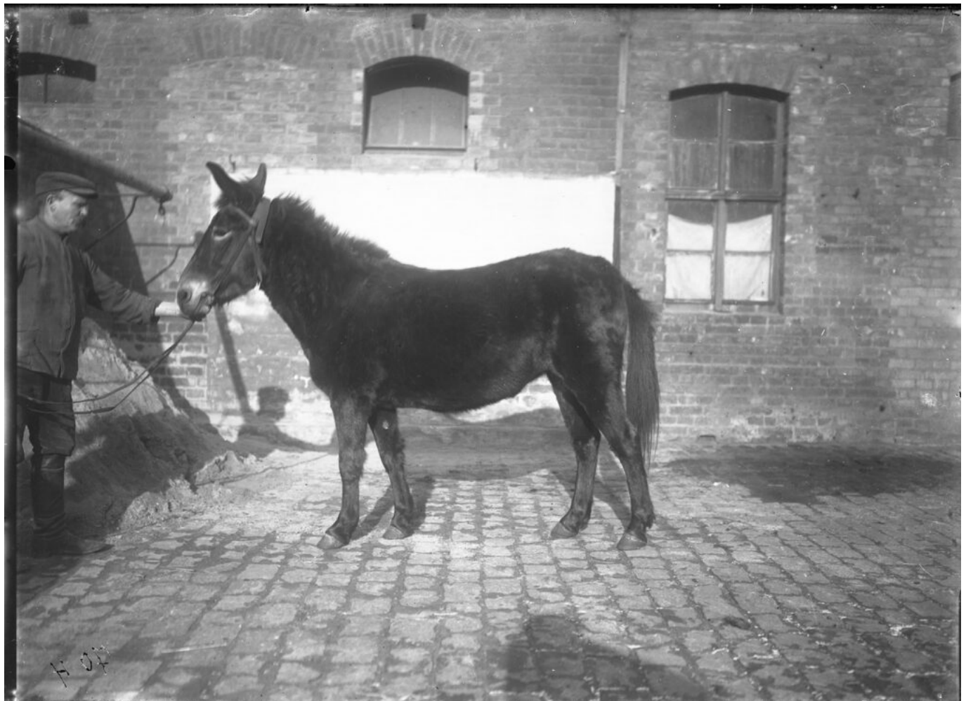
Historisches Foto eines Maultiers aus dem Museum für Haustierkunde, Halle. Maultier „Lotte“, Geschlecht: weiblich, Geburtsdatum: 12.06.1903, Tag der Aufnahme: 23.01.1911